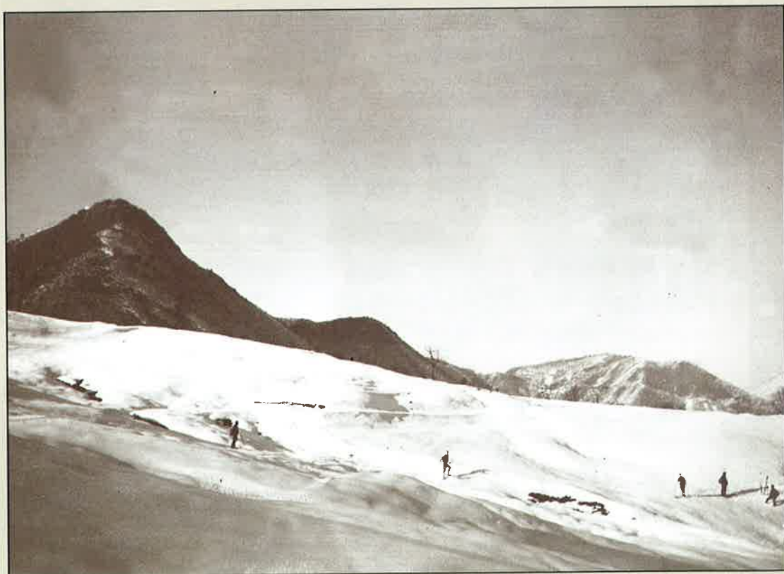
Zagrebački skijaši na livadi Preseka pod Oštrcom 1914

Novo razdoblje u razvoju skijanja započelo je 1908. Te se godine na međunarodnom skijaškom natjecanju u Češkoj istaknuo zagrebački odvjetnik Janko pl. Vodvarška koji je bio redovit gost čeških skijaških natjecanja. On je 9. veljače 1908. godine u mjestu