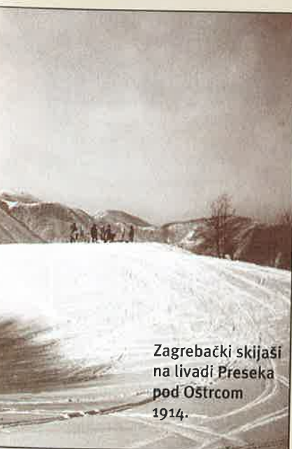
Zagrebački skijaši na livadi Preseka pod Ostrcom 1914.

Prikupljene su brojne nagrade za sve vrste natjecanja i bile su izložene u izlogu tvrtke Jesenski i Turk - Elsa - Fluid dom u Zagrebu. Prijave su se primale u prostorijama HAŠK-a u Opatičkoj ulici. Moglo se prijaviti i u Fužinama.