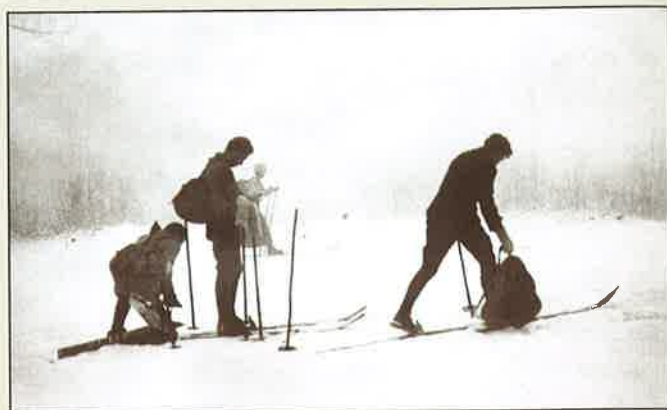
Zagrebački skijaši u Delnicama u studenome 1914.

Tako je npr. Društvo za promet stranaca u Opatiji počelo organizirati tzv. športske tjedne, da bi zainteresirani stranci posjećivali Gorski kotar, već tada poznat kao "zračno lječilište". U Fužinama i Delnicama takva su se društva osnivala kako bi se iskoristile dobre turi-stičke pogodnosti tog kraja. U napisu zagrebačkog "Obzora" iz 1910. godine o turističkom potencijalu Gorskog kotara možemo pročitati da su "zimski sporto-vi stekli toliko prijatelja da su gorski krajevi koji su zimi bili posve pusti, danas obilnije posjećeni nego li ljeti, te su postali upravo prava izletišta".